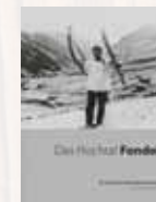
Buchtipp: «Das Hochtal Fondei» von Hans Mettier-Heinrich, CHF 15.00

Anmeldung: bis am Vorabend um 17.00 Uhr, T +41 81 374 22 55